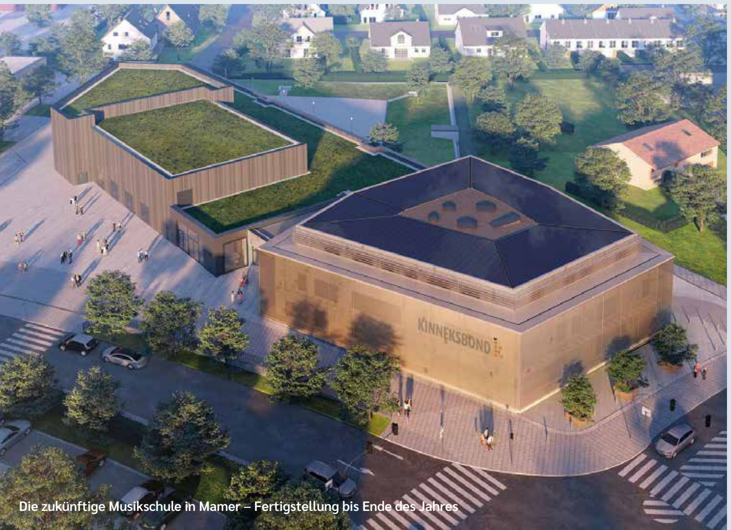
Die zukünftige Musikschule in Mamer – Fertigstellung bis Ende des Jahres