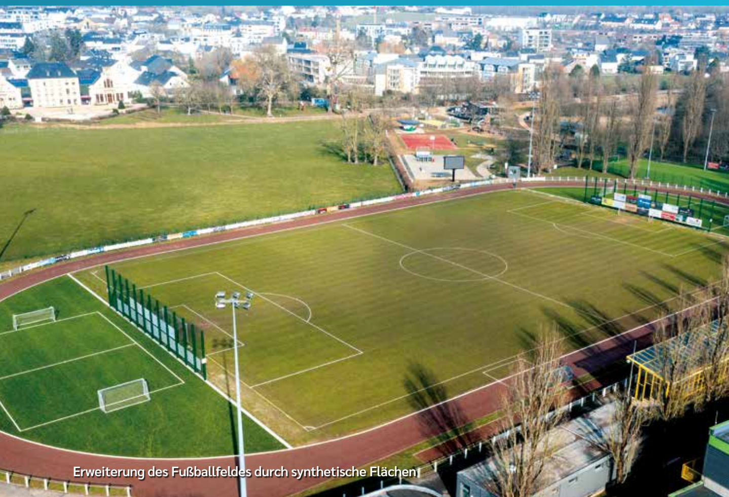
Erweiterung des Fußballfeldes durch synthetische Flächen

Daher werden wir die Anzahl der „Agents Municipaux“ von drei auf fünf Personen erhöhen. Die Kompetenzen werden ausgeweitet um zum Beispiel Verstöße gegen die Lärmschutzverordnung, Beschädigungen im öffentlichen Raum oder die Benutzung von Spielplätzen außerhalb der genehmigten Zeiten zu ahnden.