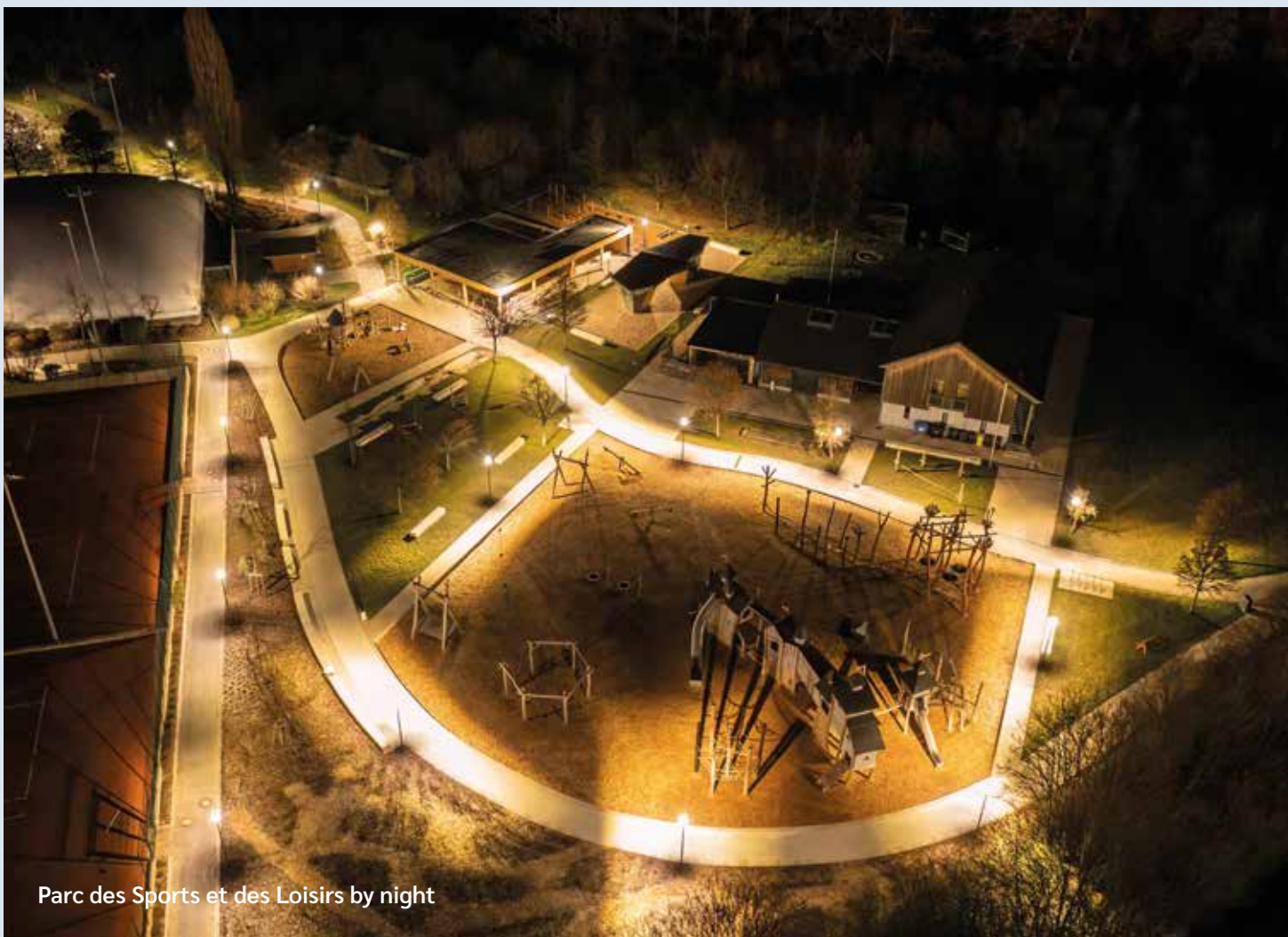
Parc des Sports et des Loisirs by night