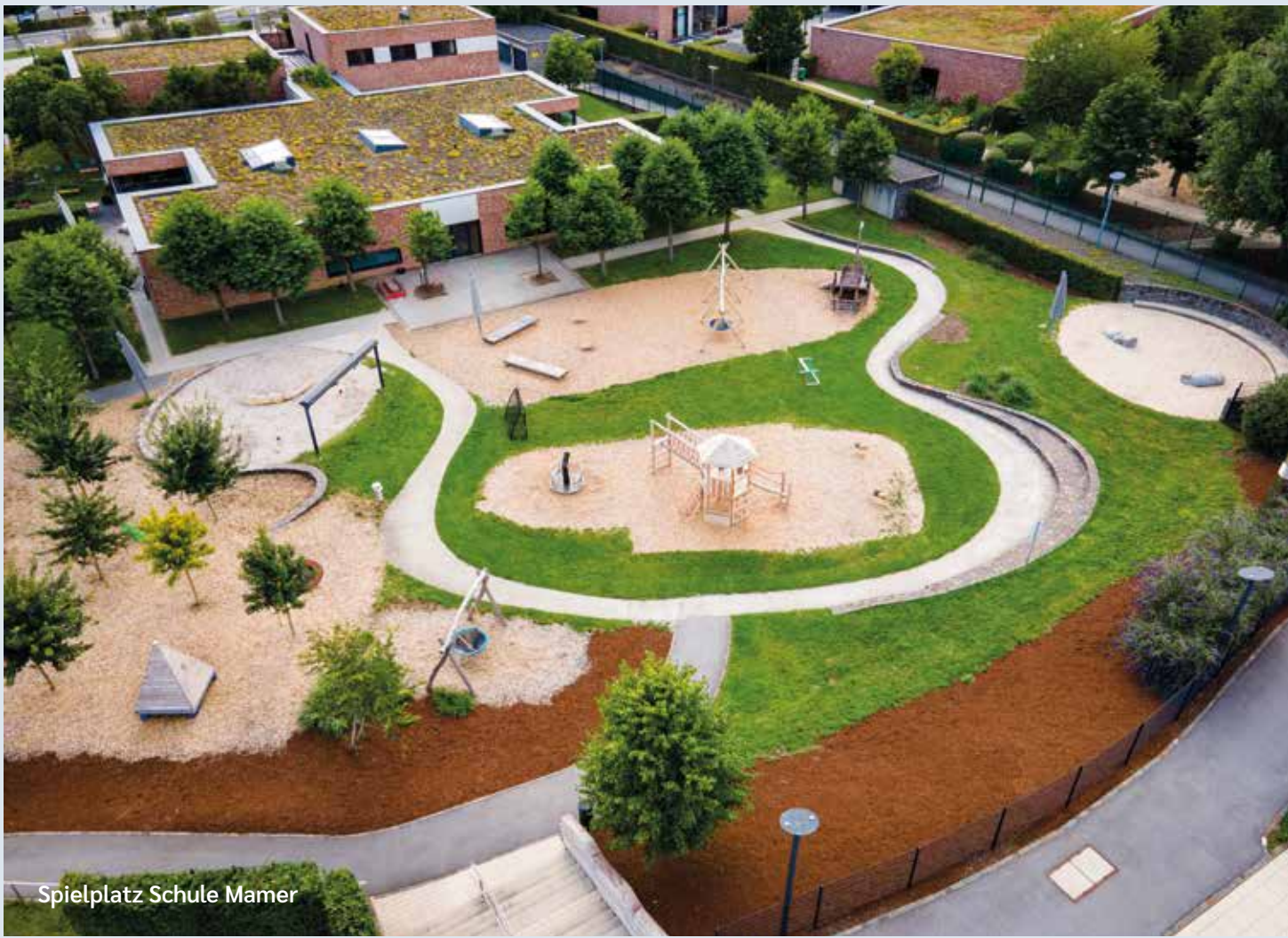
Spielplatz Schule Mamer