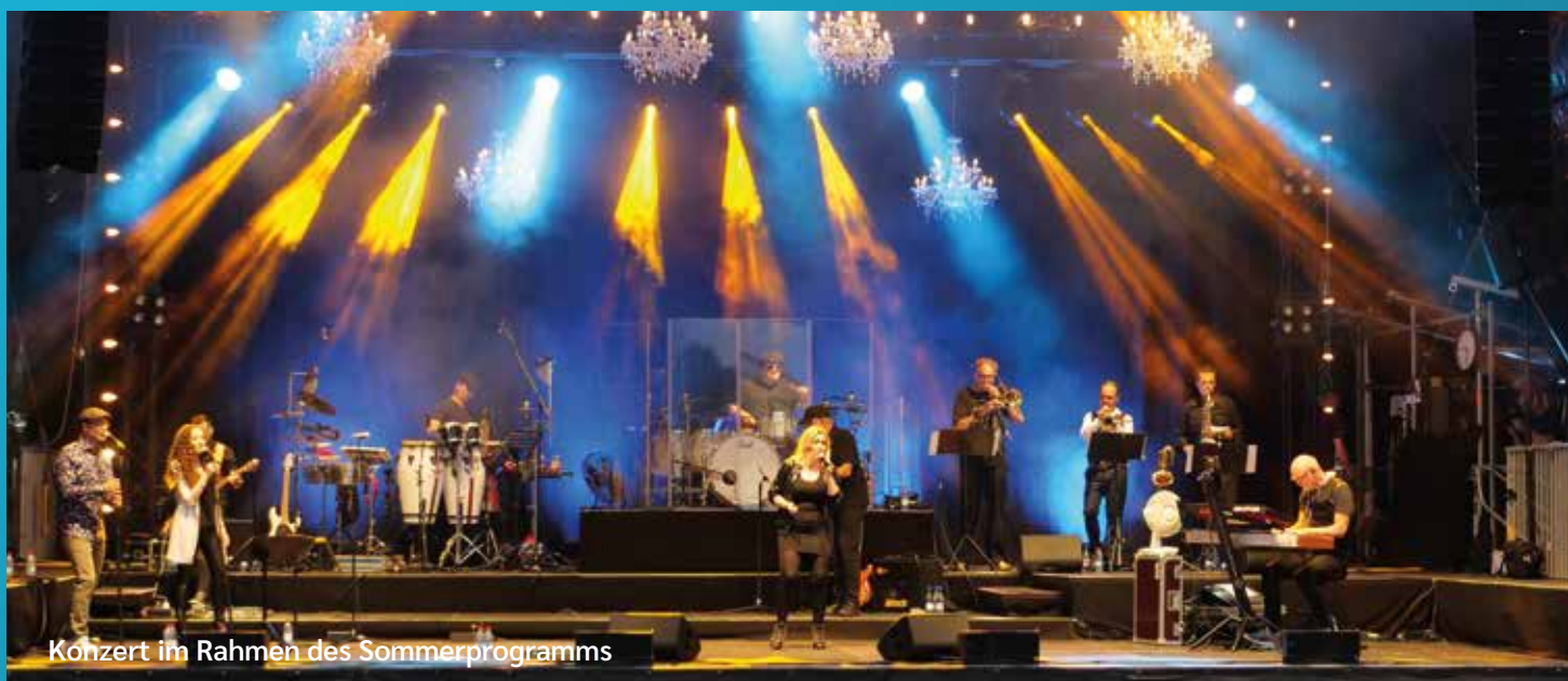
Konzert im Rahmen des Sommerprogramms

Dies indem wir einen naturnahen Fitness-Parcours im Wald mit Geräten aus Holz einrichten.