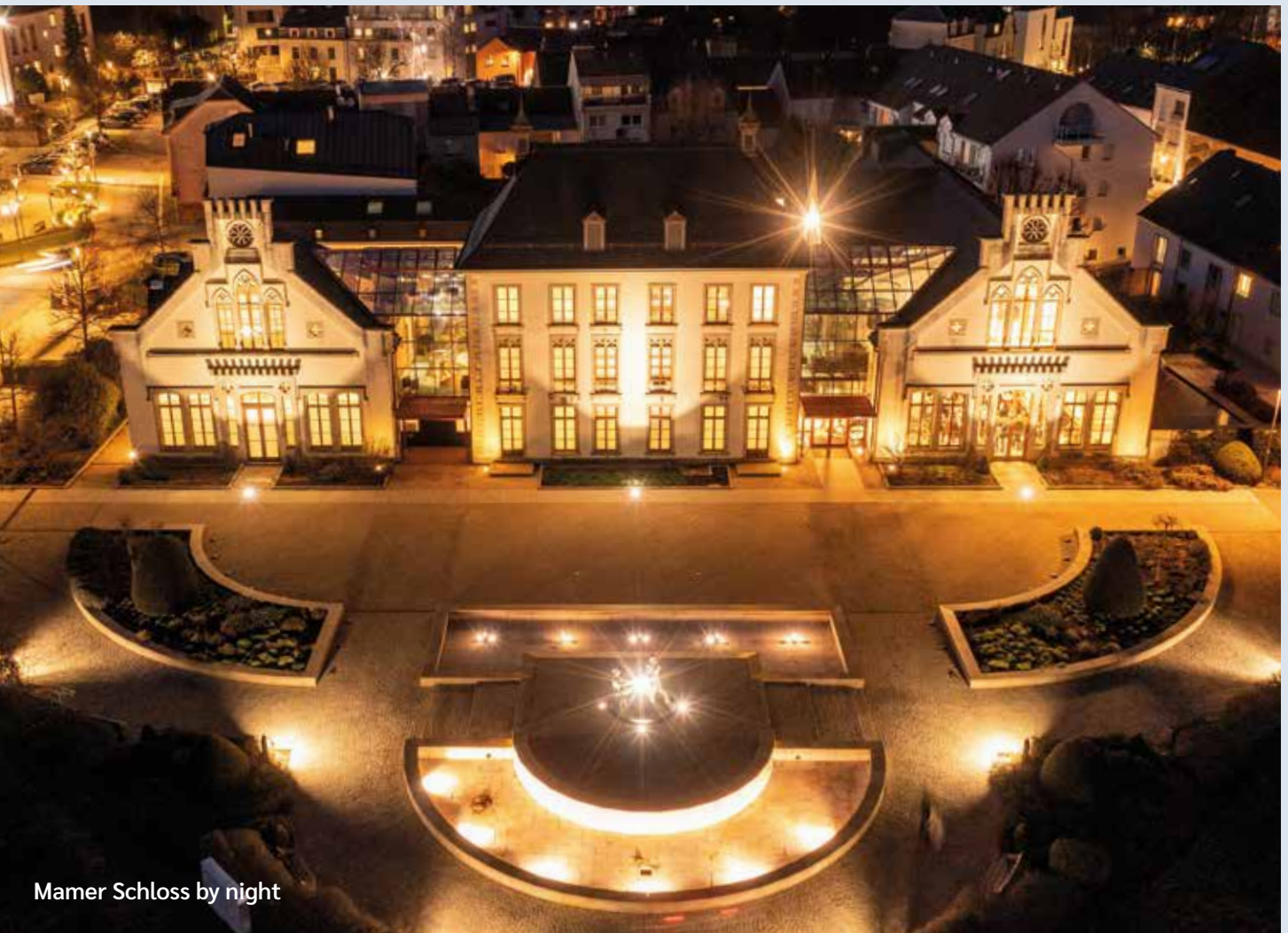
Mamer Schloss by night