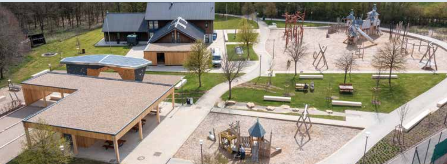
CAPELLEN PARC DES SPORTS ET DES LOISIRS : ABENTUEUR FÜR GROSS UND KLEIN 1 - 4

... FIR EE FLOTT ZESUMMELIEWEN VUN ALL DE GENERATIOUNEN ... FIR EE SOZIALT MATENEEN